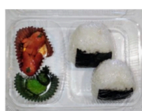
〈見本〉 おにぎりセット ご飯の量 100g