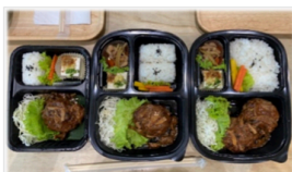
〈見本〉 煮込みハンバーグ ご飯の量 左から Sサイズ 50g / Mサイズ 100g / Lサイズ 160g