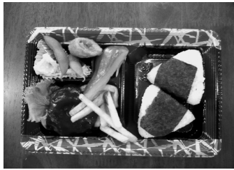
S サイズのみ ごはんはおにぎりです