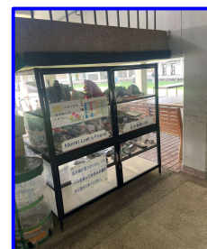
忘れ物コーナー ( レインボーゲート階段下 )