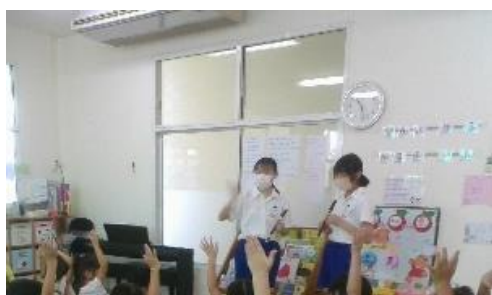
オイスカシラチャ日本語幼稚園

3年ぶりということ、初めの一步は、日本人会の皆様にご尽力をいただき、各事業所をご紹介いただきました。誠にありがたく、この場を借りて、心から感謝を申し上げます。