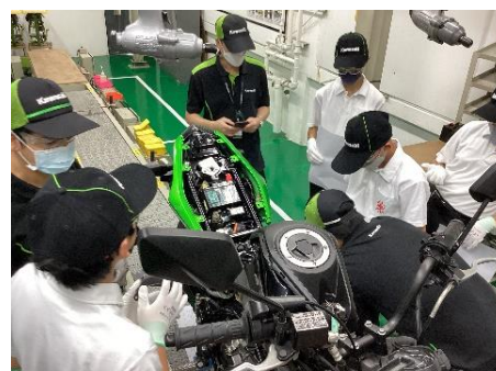
カワサキモーターズ